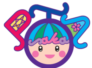
大阪府Pキャラクター「ビタマル」