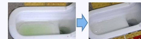
便器にこびり付いた黒ずみには、研磨シートを使用して手で磨くと綺麗になりますと実演してくれました。