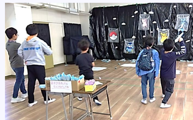
紙ひこうき飛ばし