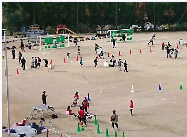
ストラックアウト・ソフトボールなげ ・キックターゲット

コロナ前のワイワイ祭りに戻すには、保護者の皆さまのご協力が必要不可欠ということ、今年度実施してみて痛感しました。