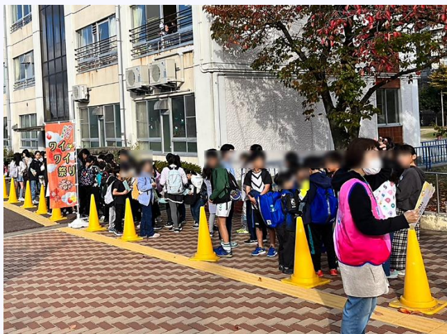
開始時間を待つ子どもたち

限定的に再開した昨年度のワイワイ祭りに続き、今年度も入れ替え制での開催となりましたが、今回はグラウンド・体育館だけでなく校舎も使って、多くの子どもたちに参加していただき、コロナ前のワイワイ祭りがまた少し戻ってきたように感じました。