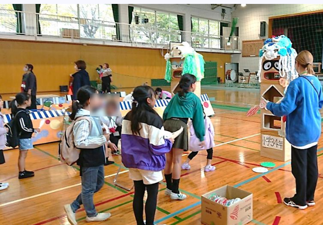
段ボールフリスビー